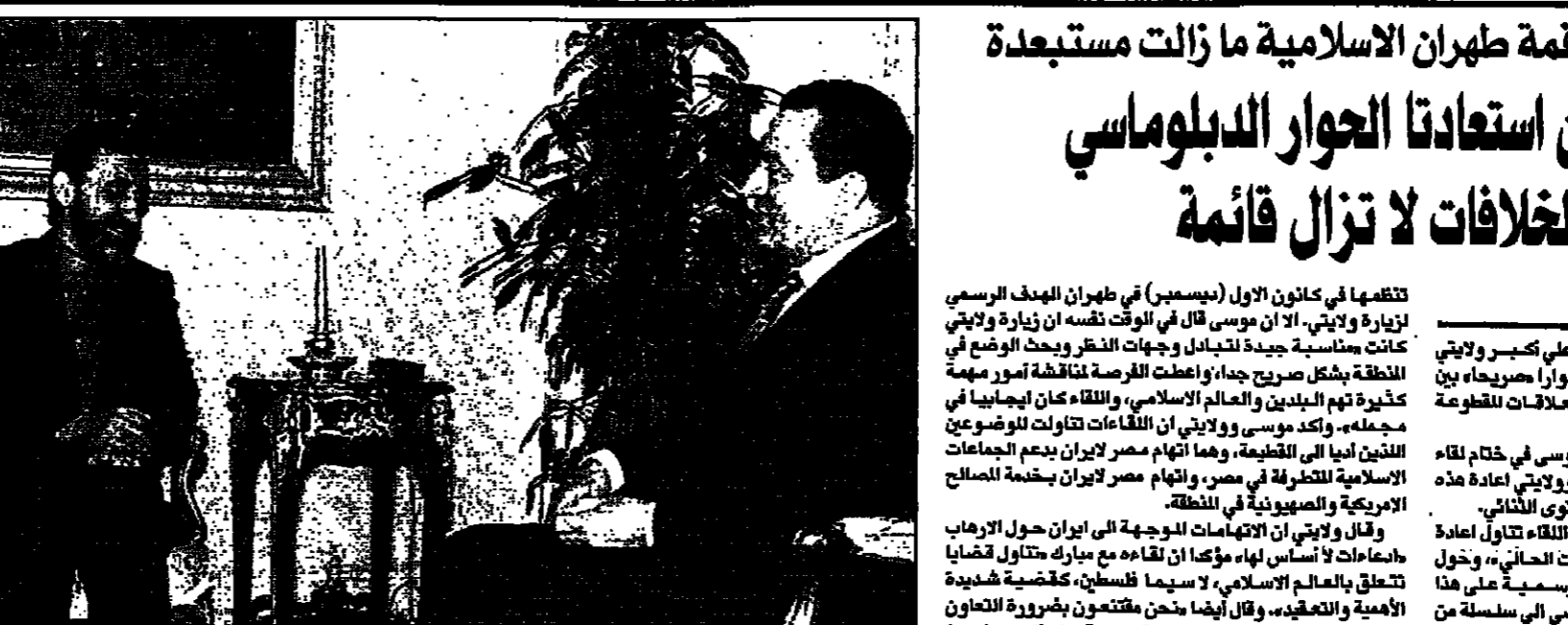
الرئيس حسني مبارك أثناء استقباله علي أكبر ولايتي وزير خارجية إيران في القاهرة حيث تسلم دعوة لحضور القمة الإسلامية المقبلة في جوبا

صحافي شاهد عيان يروي انطباعاته عن مأساة حريق منى